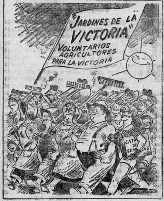
Rosello en el Hartford Times

WASHINGTON.—El agricultor de los Estados Unidos es un trabajador importantísimo en el arsenal de la democracia, puesto que proporciona asistencia imprescindible a las fuerzas armadas y a los hombres que manejan las herramientas mecánicas en las fábricas de pertrechos, ayudándolos eficazmente a soportar las cargas de la guerra total en que estamos empeñados.